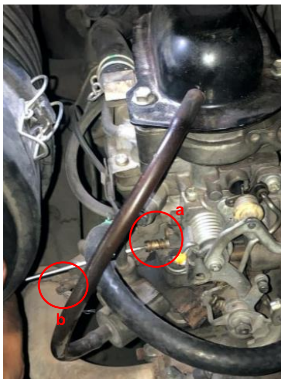
Figura 5 - Carburador e seu parafuso de ajuste de vazão da mistura ar/combustível em destaque; a) Parafuso de regulagem mistura ar/combustível; b) Parafuso de injeção de marcha lenta.

O carburador possui dois parafusos de ajuste: de regulagem da mistura ar combustível e o de injeção de marcha lenta.