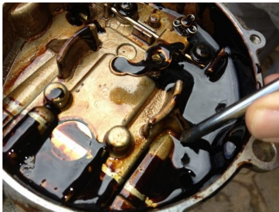
Figura 4 - Concentração de resíduo oleoso na câmara interna de um converter de empilhadeira a GLP.

Na Figura 4, abaixo, é mostrado um caso de concentração de resíduo oleoso no circuito interno de um converter de empilhadeira.