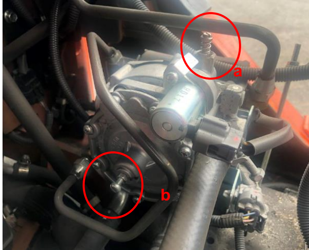
Figura 3 - Converter de uma empilhadeira Toyota; a) Parafuso de ajuste de vazão de marcha lenta; b) Parafuso de ajuste de pressão de saída de GLP.

Na Figura 3 é mostrado um modelo de converter utilizado em empilhadeiras Toyota, mostrando os parafusos de ajuste de marcha lenta e ajuste de pressão de saída. O parafuso de ajuste de pressão não foi manipulado neste estudo.