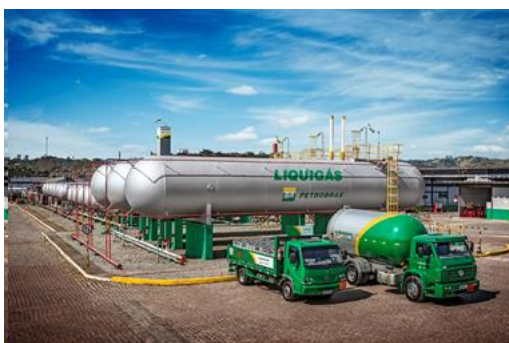
Figura 1 - Centro Operativo de Capuava

A Liquigás conta com 23 Centros Operativos, 19 Depósitos, 1 Base de Armazenagem e Carregamento rodo-ferroviário, 4 unidades de envasamento em terceiros e uma rede com aproximadamente 4.800 revendedores autorizados, além de sua Sede, na cidade de São Paulo (SP).